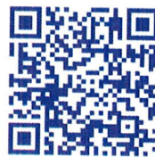
Aplikace pro IOS