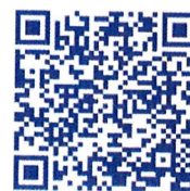
Aplikace pro Android

V přechodném období očekáváme na pobočkách fronty a přetížené telefonní linky. Pokud nebudete mít možnost nebo z nějakého důvodu nebudete chtít využít online podání žádosti o superdávku, můžete případně využít tzv. asistované podání na našich pobočkách.